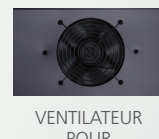
VENTILATEUR POUR CIRCULATION D'AIR