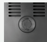
FILTRE AU CHARBON